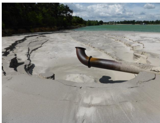
Fig. 5 Om te voldoen aan de huidige vergunning is voorjaar 2015 het 'strand' opgespoten met de op de bodem opgeslagen leem en fijn zand met bagger en slibdeeltjes.