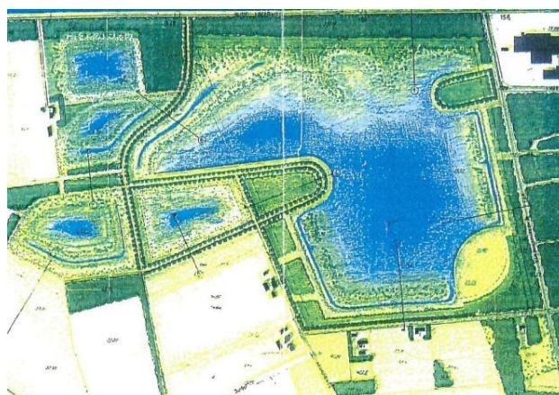
Fig. 7 Het plan conform de ontgroningvergunning 2001. Momenteel is het wateroppervlak bij de grote plas veel groter mede door de illegale ontgroningen.

Stichting Groen Weert ondersteunt een gezamenlijk plan van de natuurverenigingen. Voor dit plan wordt verwezen naar 'Visie Natuurorganisaties Ontgrondingsgebied Weert' d.d. 30-06-2015 door J. Vos. Zie ook figuur 6. Dit plan voldoet aan de coalitieafpraak.