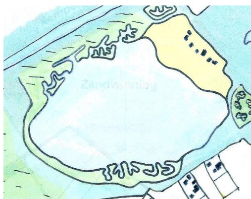
Fig. 6 Alternatief plan natuurverenigingen