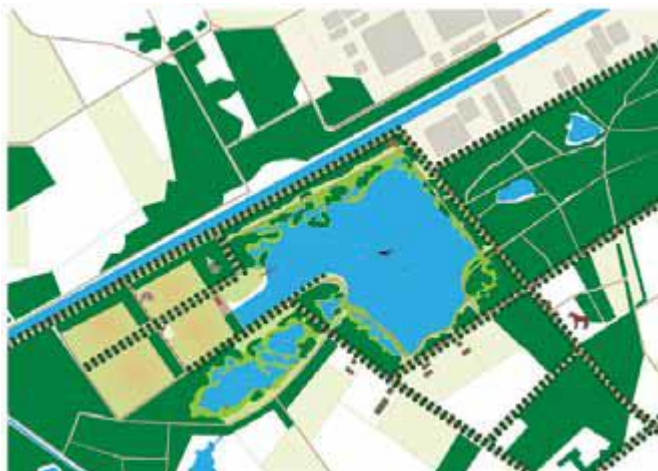
Fig. 1 Situatie zoals weergegeven in Structuurvisie 2025. Er is geen sprake van een diepe duikplas aan de Kruispeelzijde. Ook niet van een uitbreiding van de ontgroning

De concept realiseringsovereenkomst strookt niet met de Structuurvisie 2025. In deze visie is geen sprake van een grote en diepe duikplas. Wel van een gedeeltelijke verdieping naar 20 a 25m. Dus de verwijzing naar de Structuurvisie 2025 is niet correct.