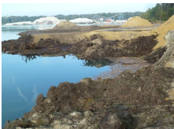
Fig. 4 Daar waar nu het strand moet komen is in het najaar 2014 84.000m 3 nutriëntenrijke grond afkomstig van de Kruispeel gestort (foto 12-10-2014).

Door de diepte van de plas van 17,5m zal men ook te maken hebben met koudwaterstromen.