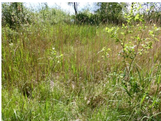
Fig. 3 Verdroging van de poel bij peilbuis 3 door het niet aanbrengen van voorgeschreven leembekleding het talud en oever kanaalzijde

Wat de educatie betreft, dit is/was al een verplichting uit de Ontgroningvergunning.